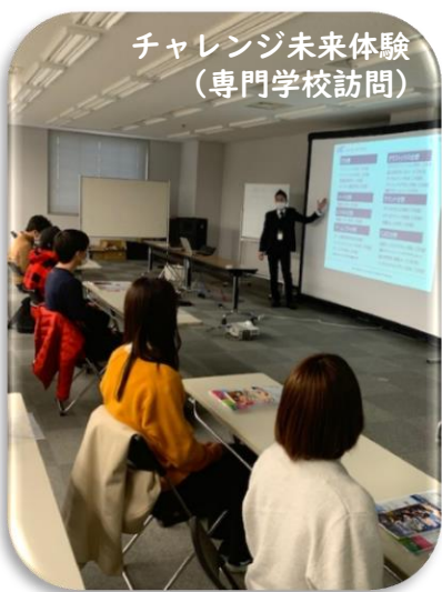
チャレンジ未来体験(専門学校訪問)