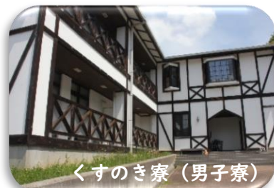
くすのき寮(男子寮)