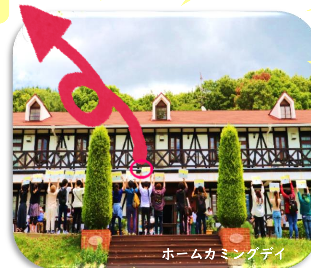
ホームカミングデイ