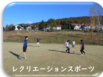
レクリエーションスポーツ