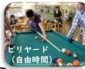
ビリヤード (自由時間)