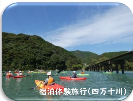
宿泊体験旅行(四万十川)