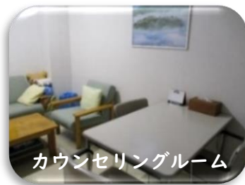
カウンセリングルーム