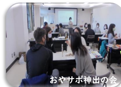
おやさぽ神出の会

神出学園に入ると、本当に明るく前向きに顔までも変化していきました。23歳で入っても、友達もでき、様々な体験を通して成長しました。子育てはしんどいばかりだと幾度も涙した日々ですが、待っていればいつかは芽を出す、動き出す時が来るんだと確信しております。(48期修了生保護者)