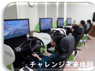
チャレンジ未来体験