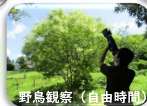
野鳥観察 (自由時間)