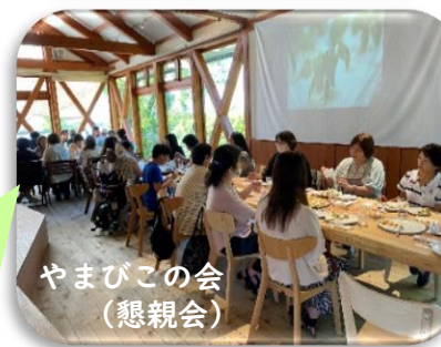
やまびこの会(懇親会)

学園の雰囲気や程よい自由度が息子に合っていたのと、自分の意志で決めたからか、意欲が出てきて色々なことに次々とチャレンジしていました。「分らん事があつたらどうしようって悩むより聞いた方が早くスッキリするわ。」「自分を客観的に見れるようになった。」など、この2年間で気付きや心の成長を感じる言葉を沢山聞ける程になりました。息子にとって神出学園はパワースポットでした！心と体で感じた全ての経験が、これから生きていく糧となるでしょう。2年間大変お世話になり、感謝の気持ちでいっぱいです。(48期修了生保護者)